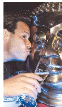
Versorgte Buddha mit Kuss und Bier: Gonzo